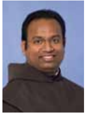
Pater Gracian Krankenhaus-Seelsorger